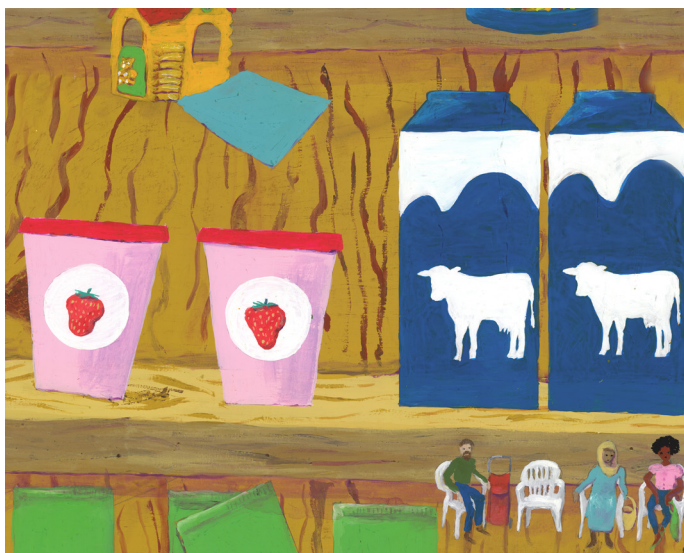
Peinture sur porcelaine, installée sur la façade du Secours Populaire (détail)