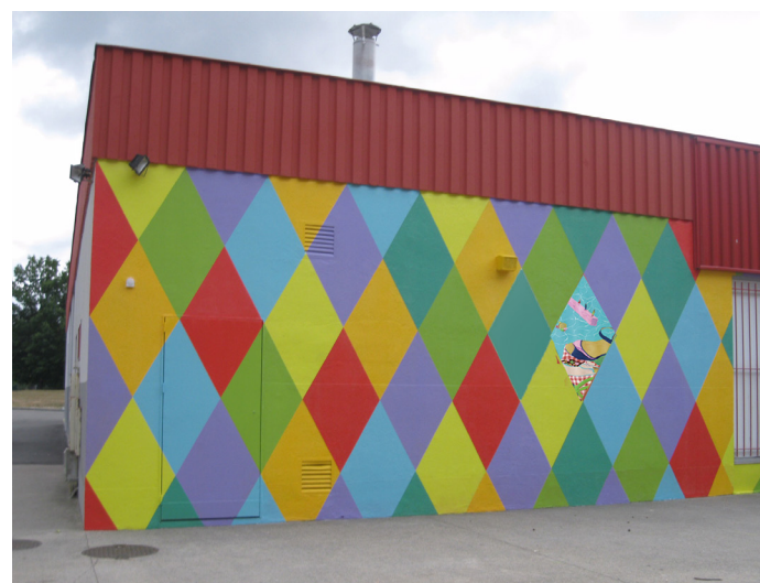
Quartier de Beaubreuil, motif Arlequin et peinture sur porcelaine