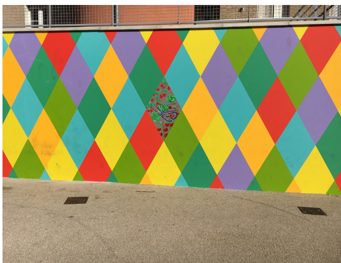
Quartier des Coutures, motif Arlequin et peinture sur porcelaine