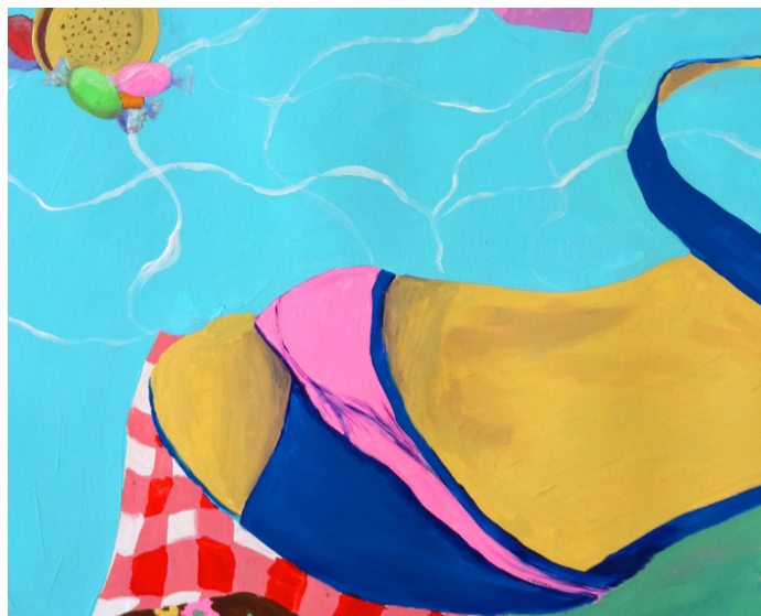
Peinture sur porcelaine, installée dans le quartier de Beaubreuil (détail)