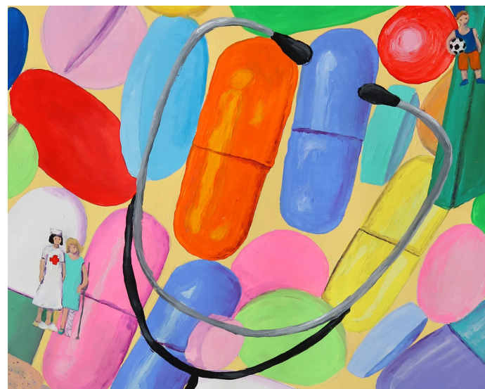
Peinture sur porcelaine, installée sur la façade du Secours Populaire (détail)